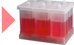
Optimum Growth 6-well plate 仕様